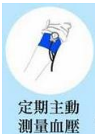
定期主動 測量血壓