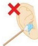
勿將棉棒伸進耳朵內 以免將藥水吸乾