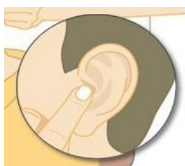
輕壓耳珠 讓藥水流入