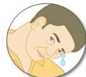
10 分鐘後將頭斜傾 讓藥水自然流出