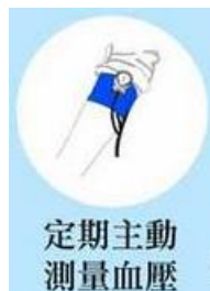
定期主動 測量血壓